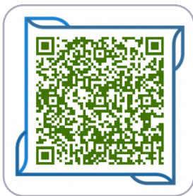
京东安联成长优享 2023儿童眼视力保险保障

请在就诊前务必查询就诊私立医院是否在网络医院列表内 如有任何疑问致电： 021-80209058（7*24小时）