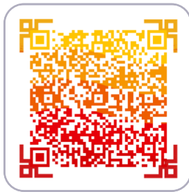
京东安联成长优享 私立儿童齿科保险（2021）